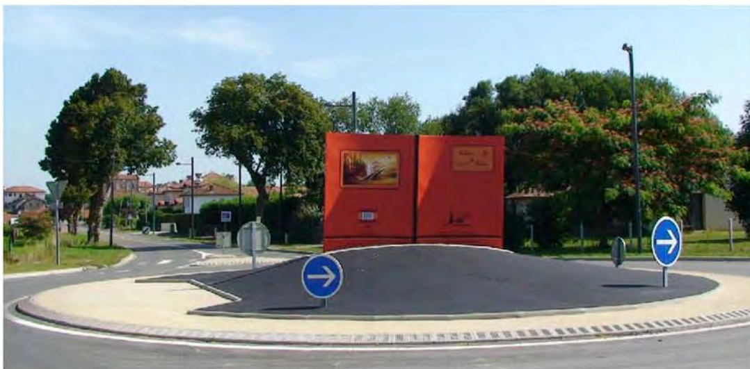
Sculptures monumentales "le Livre d'ecole" St Geours de Maremne (Landes)