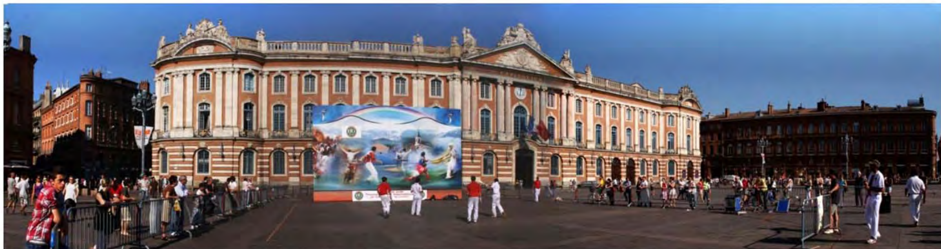
Décoration du Fronton Mobile de Pelote Passion