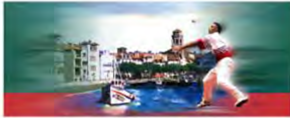
Fresques Internationaux de Cesta punta St Jean de Luz