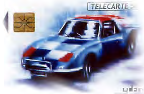
La télécarte "Matra 92 de Magny-Cours