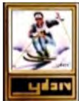
Pin's Albertville 92