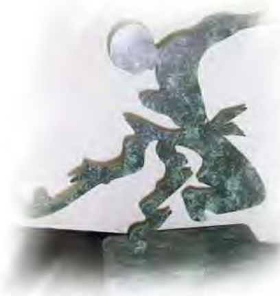
Trophés Cesta Punta St Jean de Luz