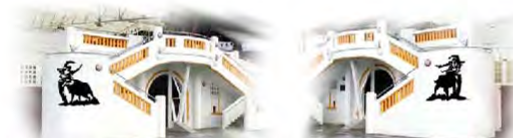
Sculptures extérieures "Course Landaise" Arènes de Pomarez (Landes)