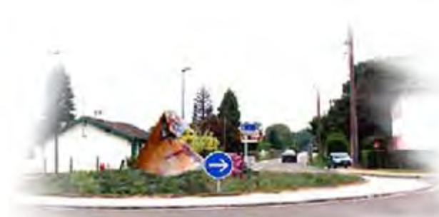
Sculptures monumentales "le Pot de Résine" St Geours de Maremne (Landes)