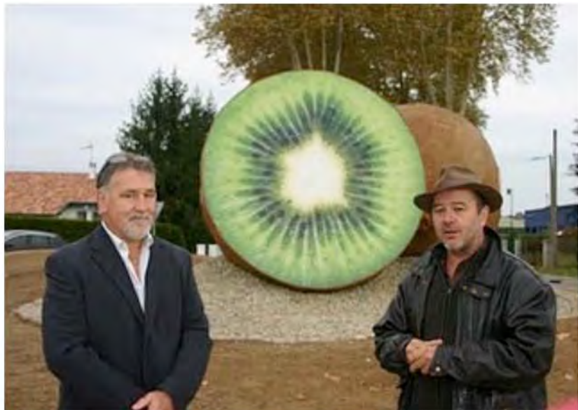
Sculptures monumentales "le Kiwi de l'Adour" Peyrhorade (Landes)