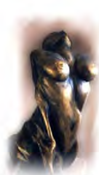
Sculpture Nudité Collection Particulier