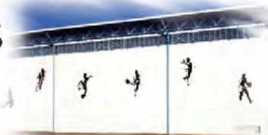
Sculptures extérieures de la salle Omnisports de St Geours de Maremne (Landes)