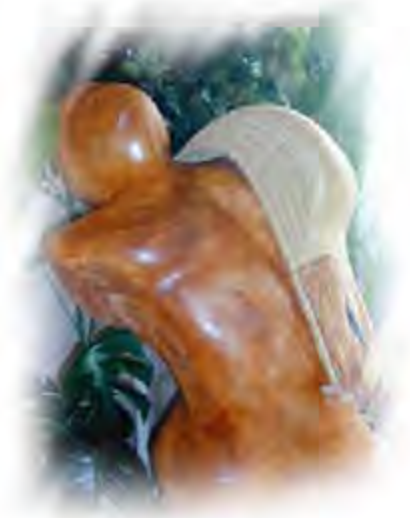
Sculpture Cesta Collection Particulier