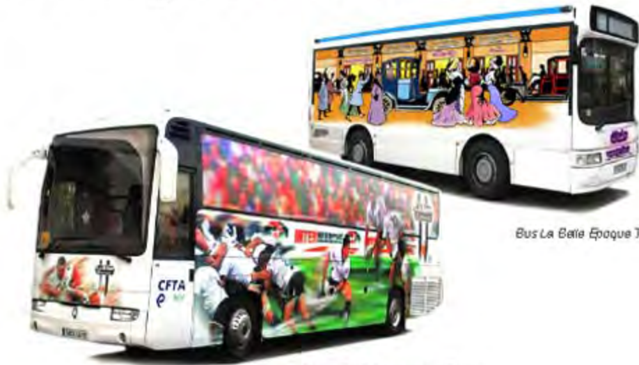
Bus La Belle Époque Tulle