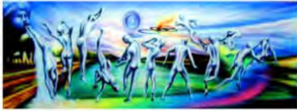
Fresque salle reception de l'Union Sportive Daquoise